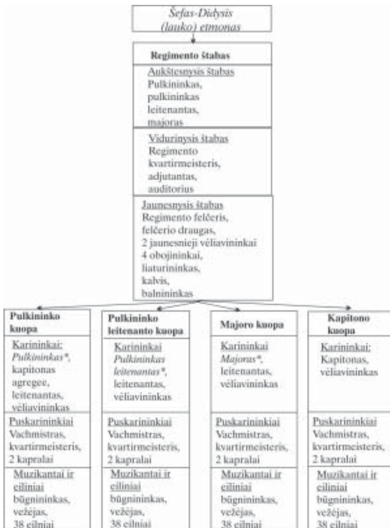
2 schema. Didžiosios (Lauko) buožės raitelių regimento struktūra 1737–1775 m.

Pastaba: Italika* pareigas ėjo nominaliai.