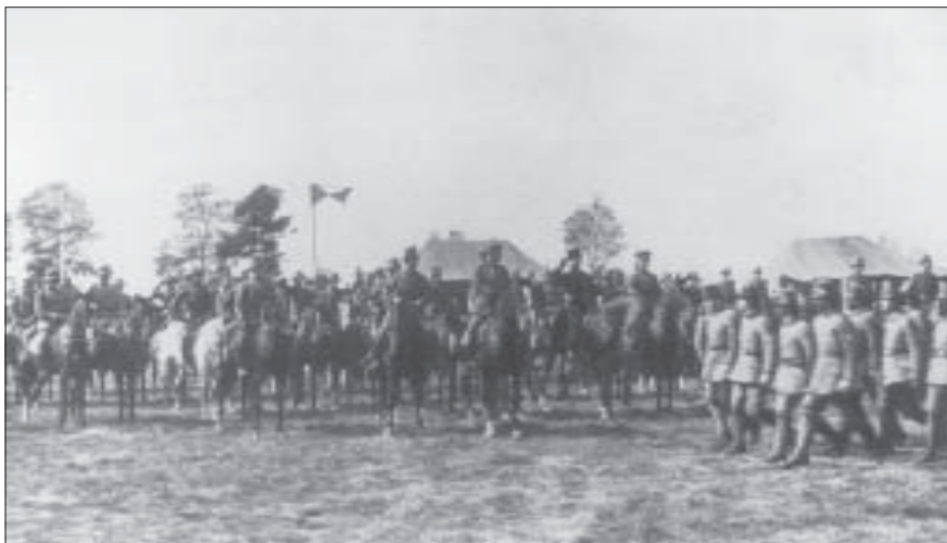
Vokiečių ir bermontininkų kariuomenės paradas Mintaujoje 1919 rugsėjo 1 d.

Spalio 6 d. visi vokiečių kariniai daliniai Pabaltijyje išliejo į VSA