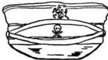
Pav. 1. Lietuvos kariuomenės "Mirties būrio" kario kepurė