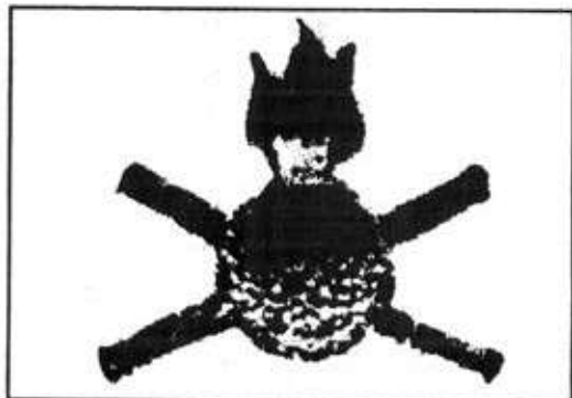
Nuotr. 1. Lietuvos kariuomenės ginklavimo korpuso karių antpečio skiriamasis ženklas