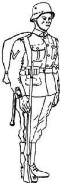
Pav. 2. Lietuvos kariuomenės grandinis 1923 m. pavyzdžio uniforma

Po šios reformos ypač išsiskyrė kavalerijos uniforma.