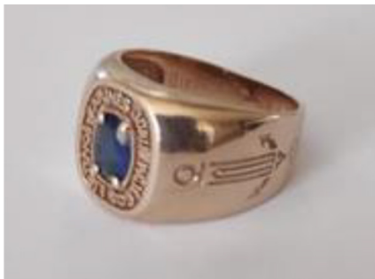
2 pav. Lietuvos kariuomenės Karinių jūrų pajėgų karininko žiedas.

je – numeris, apačioje, vidinėje pusėje, prašymas „ Dieve, laimink Lietuvą “. Žiedų gamyba finansuojama iš asmeninių lėšų, jie nešiojami laikantis krašto apsaugos ministro patvirtintų Kario aprangos ir ekipuotės dėvėjimo nuostatų.