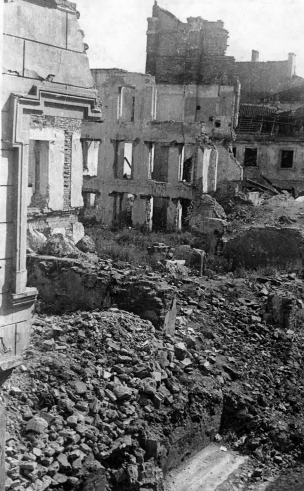
4 pav. Mūšių metu sugriauti Vilniaus pastatai, Lietuvos istorijos instituto Rankraščių skyrius

Vietomis tai griuvėsiai, kitur styro sudegusių mūrų skeletai. Kiti namai vėl skylėti, pažeidimai lokalūs ir daliniai. Visiškai sveikų namų mažai. <...> Dabartinis karas, ypač šių metų liepos įvykiai, Vilnių palietė labai skausmingai. Vilnius buvo ir iš pabūklų apšaudomas, ir bombomis iš lėktuvų apmėtomas tiek sovietų, tiek ir vokiečių. Mažiausiai nukentėjo Vilniaus bažnyčios. Nesugriauta ir Katedros aikštė, ir Napoleono aikštė už Skapo [gatvės], ir Bonifratų [bažnyčia] bei gražios senos gatvelės tarp Pilies [ga-