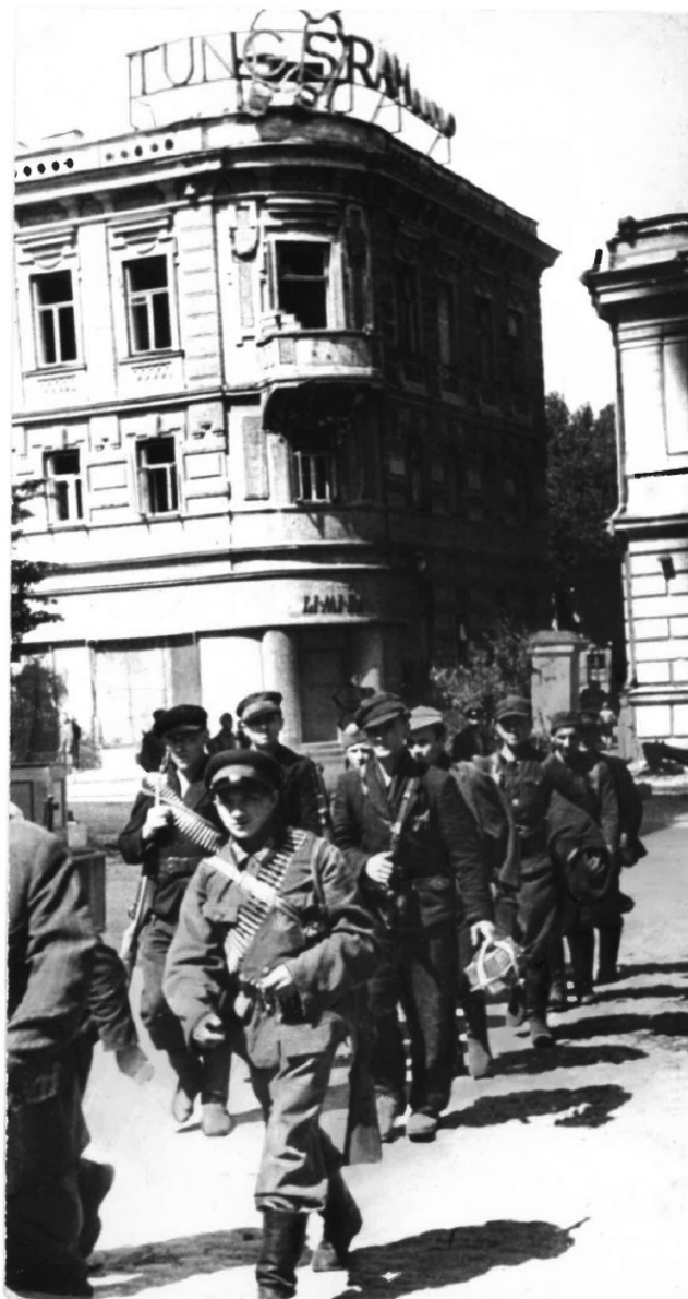
2 pav. Sovietiniai partizanai Vilniuje 1944 m. liepos viduryje.