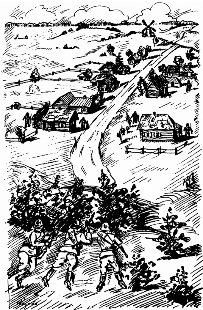
Branduoliys turi būti pasirengęs paremti žvalgus

1 priedas. Branduolio taktika. Žurnale „Karys“ publikuota iliustracija, skirta žvalgų ir žvalgų branduolio pozicijoms vykdant gyvenvietės žvalgybą pademonstruoti 133 .