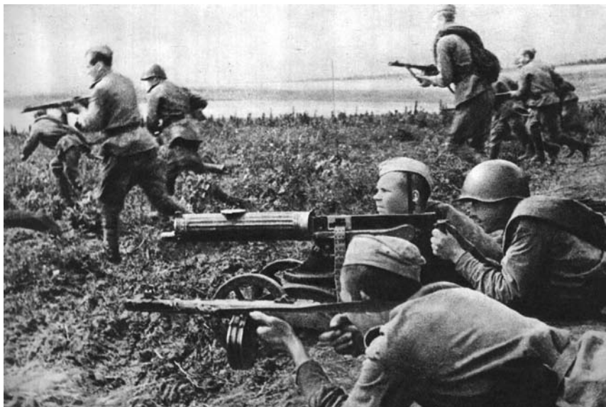
Divizijos mūšių Oriolo fronte epizodas, 1943 m. vasara

Galima tvirtinti, kad liepos 5–6 d. gynybiniuose mūšiuose 16 LŠD iš tikrųjų pasižymėjo. Jos kariai atsilaikė prieš vokiečių bandymus pralaužti jiems patikėtą gynybos ruožą (48-osios ir 13-osios armijų sandūroje), įvykdė jiems iškeltus aukštesniosios karinės vadovybės uždavinius. Tiesa, lieka neišskus 16 LŠD priskirtų drausmės dalinių vaidmuo divizijos veiksmuose.