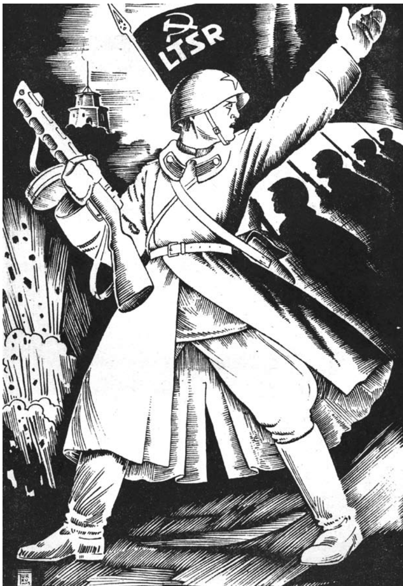
Dailininko V. Jurkūno piešinys, simbolizuojantis lietuviškosios divizijos kovą (juo iliustruotas 1944 m. Maskvoje išleistas leidinys divizijos dvejų metų sukakčiai paminėti „Lietuviškosios divizijos kovų kelias“)