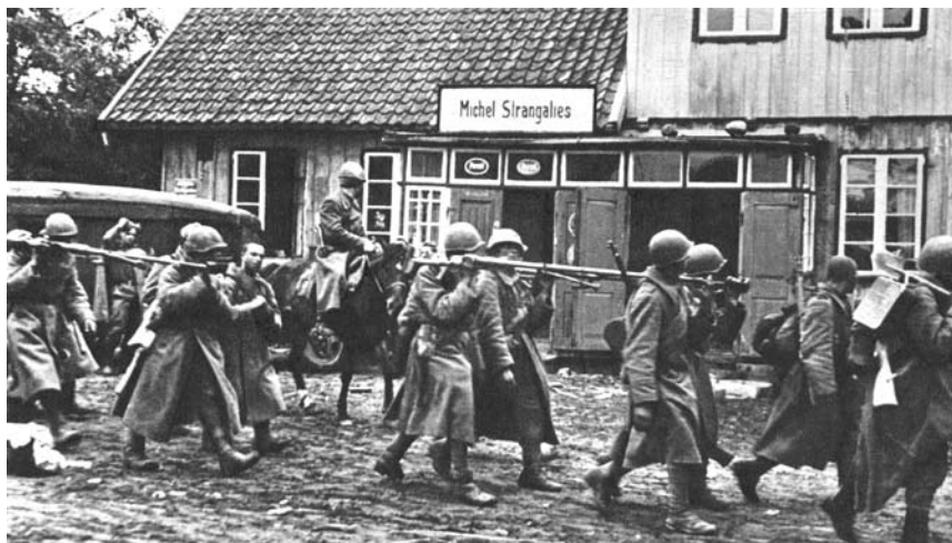
16 LŠD kariai žygiuoja per Stoniškių kaimą Šilutės apylinkėse, 1944 m. spalio

Nors karas dar tęsėsi daugiau kaip pusmetį, šiomis kovomis (neskaitant trumpo Klaipėdos „vadavimo“ epizodo 1945 m. sausio pabaigoje) lietuviškoji divizija baigė savo karinius veiksmus Lietuvos teritorijoje.