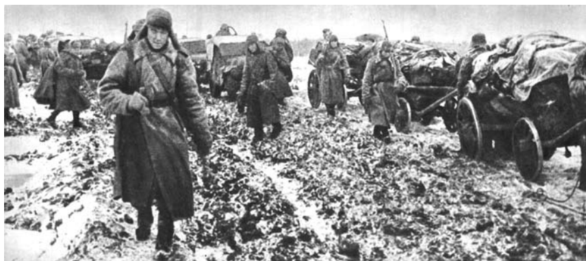
Divizijos kariai Nevelio (Pskovo sr.) apylinkėse, 1943 m. ruduo.