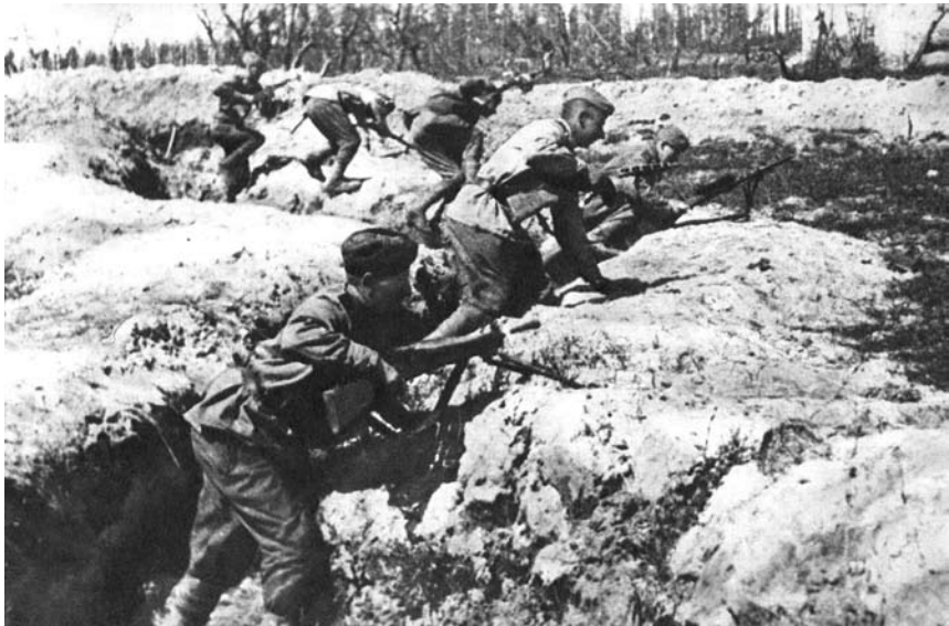
Divizijos mūšių Kurše (Latvijoje) epizodas, 1945 m.

„Vaizdas buvo baisus. Tarp Vartajos upelio ir vokiečių apkasų, kurie buvo aukštumos šlaituose, visas plotas buvo nusėtas mūsų divizijos karių lavonais. O vokiečiai kaip sėdėjo, taip ir liko besėdį savo apkasuose. Mačiau, kad prie prieštankinių pabūklų, kurie buvo traukiami atakon arklių, netoli vokiečių apkasų, ant šlaitų, gulėjo ištisų tarnybų lavonai, taip pat ir iššaudyti arkliai. Kai kur dar ilgai matėsi, kaip sužeistieji kilnoja rankas šaukdamiesi pagalbos, bet niekas jau į juos nekreipė dėmesio. Tarptautinės taisyklės dingio, kariavo laukiniai. Pavakariais daug kas iš jų gyvybės ženklų jau nerodė. Ir taip visur, kiek tik kur akys matė – lavonai, lavonai <...>“ 134