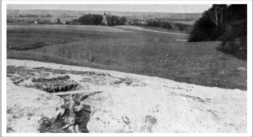
Artilerijos sviedinių sprogamų žymės prie Piktupėnų. 1914 m. ruduo