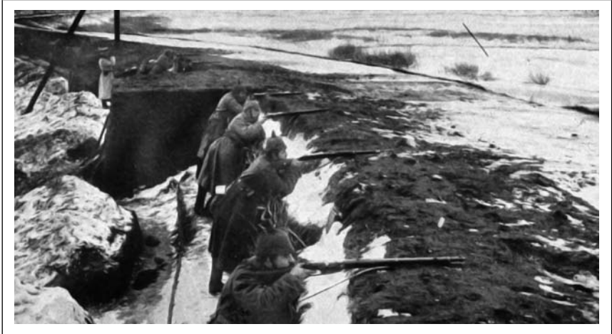
Kaip gynybiniai įtvirtinimai Vokietijos kariams pasitarnavo ir Nemuno pylimai, pastatyti siekiant apsisaugoti nuo pavasario potvynių. 915 m. žiemos pabaiga–pavasario pradžia