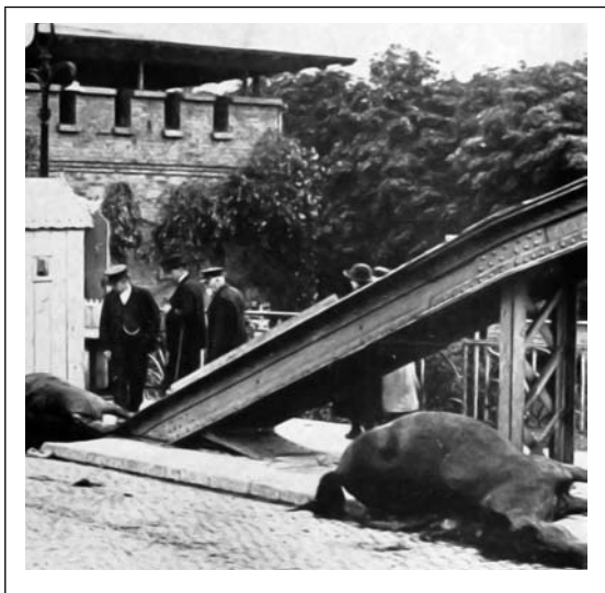
Po Rusijos karių atsitraukimo iš Tilžės ant Karalienės Luizos tilto palikti kritę arkliai. 1914 m. rudenį

Rugsėjo pradžioje Rusijos daliniai stovėjo kairiajame Gilijos krante prie Skiepių kaimo (dabar Мостовое, Kaliningrado sritis). Jų veržimasi turėjo sustabdyti Šilutės apskrities landšturmo kariai. Šiuo tikslu prieš Rusnę buvo įrengti įtvirtinimai, iškasti apkasai. Baiminantis, kad gali nepavykti sulaikyti priešininko, prie Rusnės stovėjo parengti garlaiviai, kurie turėjo išgabenti Vokietijos karius atsitraukimo atveju 42 . Tačiau to neprireikė. Papildomai į šį regioną sutraukti Vokietijos daliniai pradėjo staigiai ir sėkmingai stumti priešininką iš šiaurinių Rytų Prūsijos žemių.