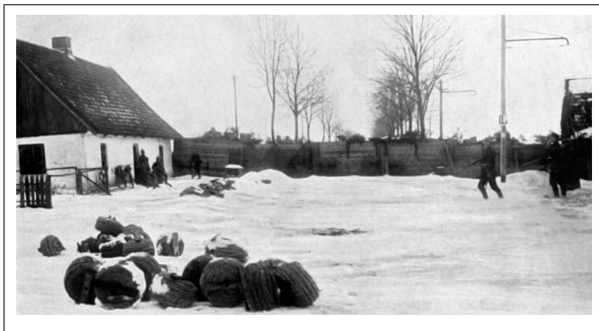
Vokietijos karių barikados, pastatytos siekiant sustabdyti Rusijos pajėgų puolimą link Tilžės. 1915 m. pavasario pradžia