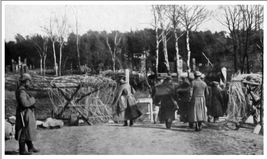
Rusijos ir Vokietijos pasienio postas prie Smalininkų. 1914 m.