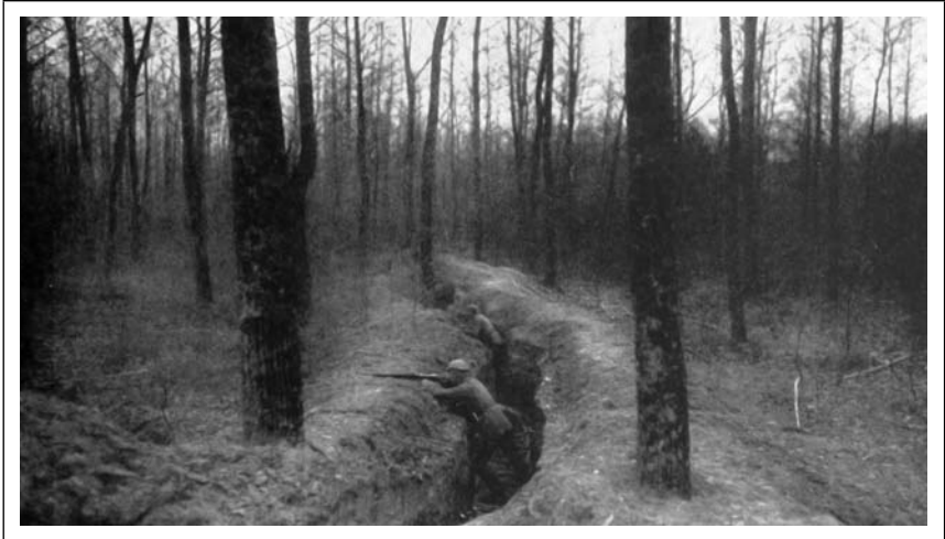
Vokietijos kariai apkasuose. 1914 m. ruduo

Ilgiau nei mėnesį trukusi Tauragės okupacija baigėsi lapkričio pradžioje. Po sėkmingos Mozūrijos operacijos baigties Vokietijos karinė vadovybė buvo priversta kiek pristabdyti 8-osios armijos puolimą šiaurės rytų kryptimi ir ypatingą dėmesį sutelkti į Rusijos pietvakarių frontą. Tai daryti ją vertė išipareigojimais Austrijai-Vengrijai ir sunki šios šalies padėtis 54 . Savaiame suprantama, jog priešininkų jėgos susilpnėjo ir šiame regione. Pasinaudodama