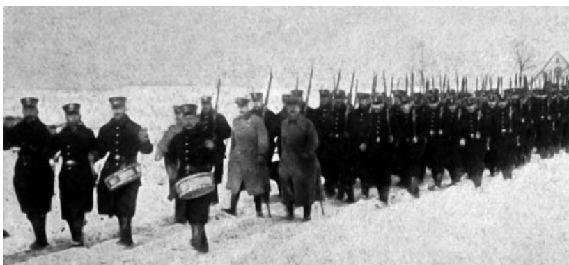
Vokietijos landšturmų daliniai žygyje