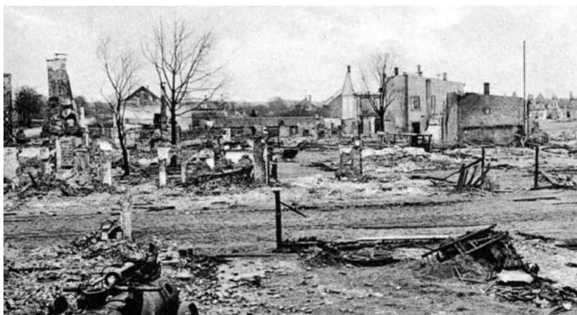
Pirmojo pasaulinio karo kovų suniokotas Tauragės miestas. 1915 m. pavasaris (TKM)