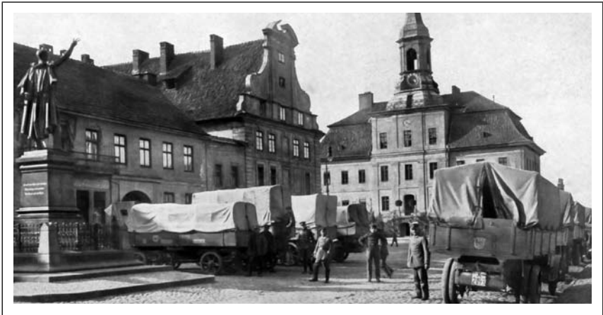
Vokietijos kariuomenės sunkvežimiai ir vežimai Tilžės turgaus aikštėje. 1914 m.

Rugpjūčio 26 d. čia jau šeiminkavo svetima kariuomenė 38 . Taip šiuos įvykius apibūdina amžininkas: