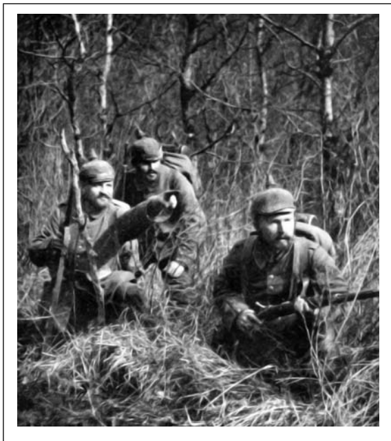
Vokietijos kariuomenės žvalgai. 1914 m. ruduo

landvero brigada užėmė įtvirtintą Rusijos pajėgų poziciją prie Piktupėnų 50 . Laikraštyje Viltis užsimenama, kad tą pačią rugsėjo 18 d. apie 11–12 val.