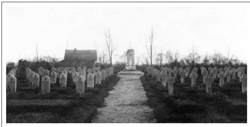
Vokietijos ir Rusijos karių, žuvusių Tauragės apylinkėse Pirmojo pasaulinio karo metu, kapai. Tauragė XX a. 3–4 deš. (TKM)

Puolančiąjai pusei teko nelengva užduotis – pereiti kelią užtvėrusią Ežeruoson upelio slėnio juostą. Dėl to Rusijos kariai turėjo daugiau laiko išitvirtinti 181 . Įveikusių šią kliūtį Vokietijos karių laukė dar rimtesnė užduotis – pereiti ištvėrusią Jūros upę. Vokietijos inžinieriniai daliniai pradėjo statyti perkėlą. Ir vėl gamtinės sąlygos jiems buvo palankios – pradėjo vėsti oras 182 . Kol inžinieriniai daliniai statė tiltą, puolimo parengimą vykdė Vokietijos artilerija. Kovo 27 ir 28 dienomis Tauragė buvo apšaudoma iš artilerijos pabūklų, dėl to ypač nukentėjo pietinė miesto dalis 183 . Tiesa, šie šaudymai neliko be atsako. Vokietijos karių bandymus užimti Tauragės miestą labai apsunkino Rusijos artilerijos ugnis, kuri buvo koreguojama iš Tauragės bažnyčios bokšto. Būtent dėl šios priežasties šis statinys tapo labai svarbiu Vokietijos artileristų taikiniu 184 . Kovo 27 d. po pusiaudienio virš Tauragės miesto pasirodė vokiečių žvalgybos lėktuvas. Apsukęs kelis ratus apie miestą, jis nuskrido. Netrukus Vokietijos pajėgos pradėjo labai smarkiai šaudyti iš artilerijos pabūklų 185 . Kovo 28 d. ugnis šiek tiek susilpnėjo, pasidarė retesnė, tačiau apšaudymo metu pagaliau buvo sunaikintas labai svarbus Rusijos kariams stebėjimo punktas – Tauragės bažnyčia 186 .