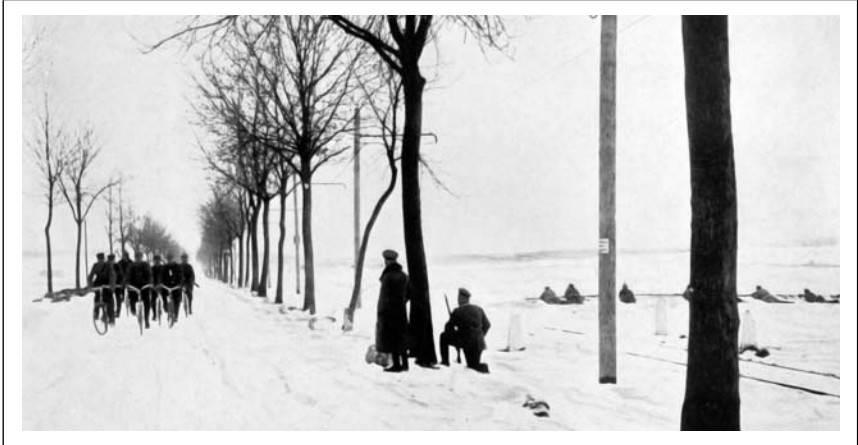
Vokietijos kariuomenės dviratininkai grįžta į Tilžę. 1915 m. žiema (VDKM)

bendruomenei priklausančius žmones 89 . Bijant galimo vokiečių puolimo ypatingų saugumo taisyklių įsakyta laikytis Kauno–Liepojos geležinkelio linija kursuojančiuose traukiniuose: „ Liepojos–Romnų geležinkelio valdybos paskelbta toks įsakymas. Traukiniui važiuojant tarp stočių Kėdainiai–Žeimiai, Jonava–Gaižūnai, Luša–Venta ir Grobin–Pleikė, turi būti uždarytos durys, langai, išeinamosios vietos ir tuo laiku niekas negali stovėti priešduryje. “ 90