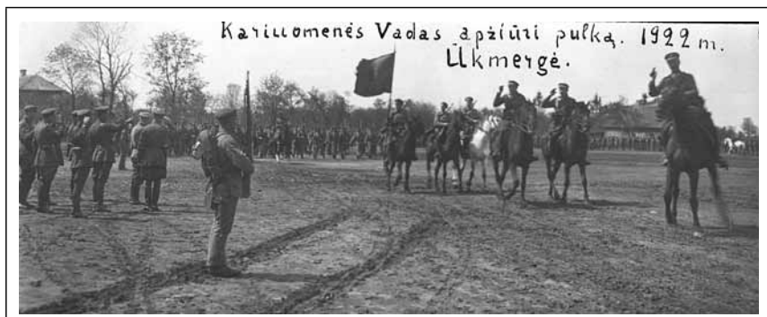
Kariuomenės vadas apžiūri pulką Ukmergėje. 1922 m.