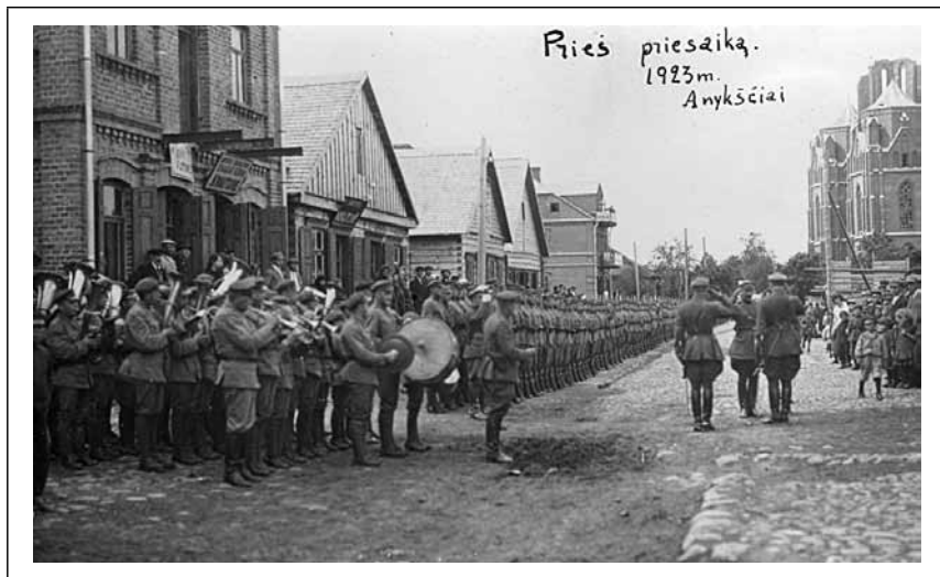
Pulkas išrikiuotas jaunų karių priesaikai. (VDKM)

3-is pėstininkų Didžiojo Lietuvos Kunigaikščio Vytauto pulkas buvo tvarkingas, tikiu, kad jis ir bus tvarkingas. 209