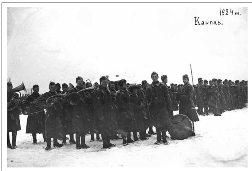
Pulkas išrikiuotas divizijos vado apžiūrai (VDKM)

pradėjo gyventi taikos meto sąlygomis 227 . Pulko štabas užėmė du namus Iğulos bažnyčios aikštėje – Laisvės al. ir Gedimino gatvių sankryžoje. Batalionai išsidėstė Žaliakalnyje, „Šapiro“ kareivinėse ir „Saulės“ namuose, ūkio kuopa – Šančiuose, Mokomoji kuopa – V forte, Karininkų ramovė – Lukšio gatvėje 228 .