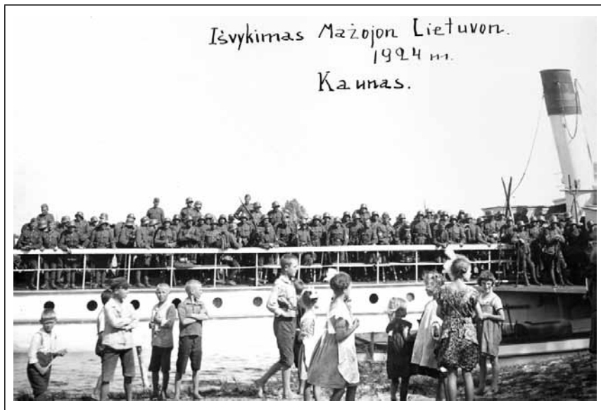
Pulko kariai garlaiviu išvyksta į Šilutę (VDKM)

Dvi kulkosvaidžių bataliono kuopos ir husarų eskadronas buvo įkurdinti praktiškai gyventi netinkamuose buvusio pasienio pulko barakuose, kurių grindys buvo supuvusios, dauguma langų – be stiklų, per sienų plyšius švilpavo vėjai. Kareiviai buvo priversti miegoti ant grindų, o padaryti nors menką remontą pulkas neturėjo galimybių, nes nebuvo tam skirta lėšų. Viena kuopa buvo apgyvendinta daržinėje. Kareiviams čia teko miegoti tiesiog ant daržinės pado. Arkliai buvo laikomi lentinėje, kiaurai vėjų perpučiamoje pašiūrėje, todėl galėjo susirgti 237 .