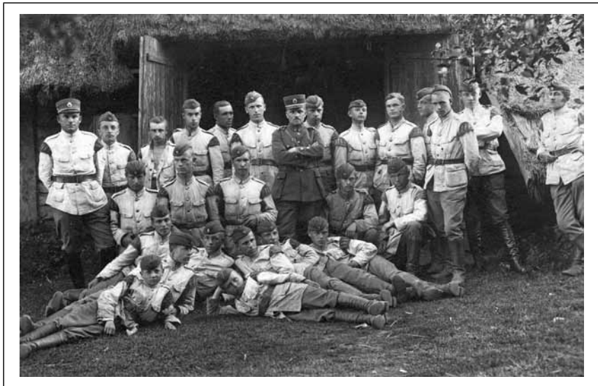
Pulko muzikantų komanda. 1926 m.