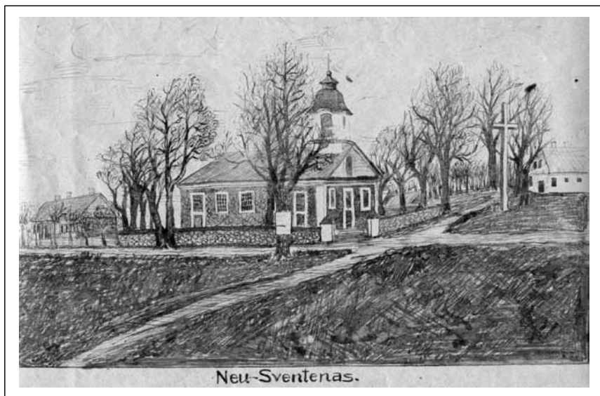
Sventės dvaras ( Tėvynės vaduotojas , 1920, birželio 20, p. 7)

1919 m. gruodžio 10 d. pulkas perėmė Joniškėlio bataliono saugotą fronto barą nuo Kazimieriškio dvaro iki Nichnovkos kaimo. Daugpilio tilto dešinėje veikė 23-iasis lenkų pulkas, kairėje – nuo Kazimieriškio dvaro – Trečiasis latvių pulkas. Pulko vadas batalionams įsakė saugoma-me bare prie Dauguvos įrengti gynybos punktus ir atramos postus pasitelkus atsarginių kuopų ir vietos gyventojų pajėgas.