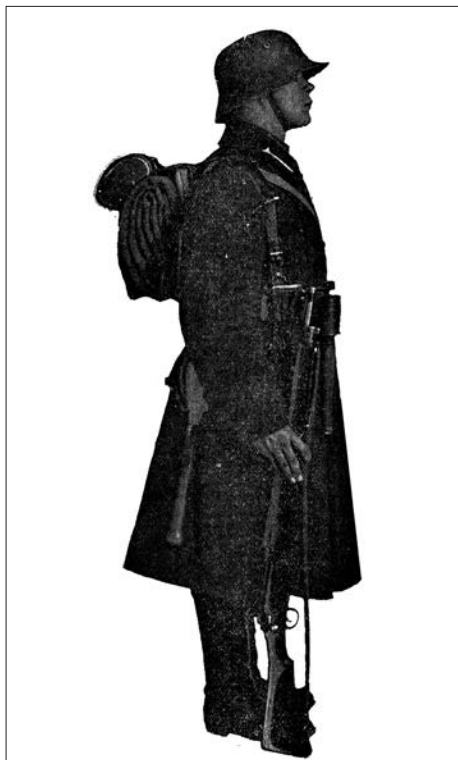
Karo milicijos mokyklos kareivio ginkluotė ir ekipuotė. Apie 1930 m. Karo policijos mokyklos kareivis, ginkluotas britišku šautuvu „Ross-Enfield M-14“ (Kauno karo komendantūra 1919–1929, red. P. Jurgelevičius, p. 51)

nastikos pratimus kareiviai atlikdavo mūvėdami ne ilgomis, o trumpomis kelnėmis ir avėdami trumpaauliais batais 160 . KPM kariai buvo ginkluoti šautuvais, durtuvais, turėjo nedidelę kuprinę. Mokyklos įkūrimo pradžioje kariai buvo ginkluoti vokiškais 1898 m. modelio „Mauser“ šautuvais, 1924 m. – Italijoje įsigytais 161 britiškais „Ross-Enfield M-14“ šautuvais.