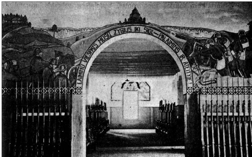
Karo policijos mokyklos kareivinių vidus (Kauno karo komendantūra 1919–1929, red. P. Jurgelevičius, p. 53)

krn. J. Jočys 42 . Ši kuopa turėjo sargybos postus keturiuose miesto vietose: prie Kauno komendantūros rūmų buvo paskirtas vyresnysis ir dvylika kareivių 43 , vienas kareivis – prie viešbučio „Metropolis“, prie Kauno įgulos areštinės sargybą ėjo vyresnysis ir 17 kareivių, prie Armijos teismo – du kareiviai 44 .