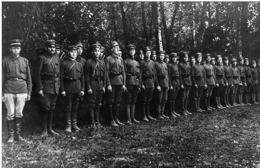
Karo policijos mokyklos būrio karių rikiuotė. Apie 1925 m. Karo policijos mokyklos kariai dėvi 1920 m. modelio lietuvišką uniformą ( Krašto apsauga , 2009, Nr. 5, p. 10)

riuomenės uniformą, buvo patvirtintas ir karo policininkų skiriamasis ženklas – akselbantas 149 . Žalios spalvos iš vienos pynelės su metaliniu galu akselbantas buvo segamas ant kairiojo peties ir antros iš viršaus munduro sagos 150 . Jį karo policininkai, kaip tarnybos ženklą, privalėjo segėti tik tarnybos metu, t. y. patruliuodami 151 . Patruliuojančių karo policininkų ekipuotę sudarė kepurė, munduras ar milinė, kelnės, sukišamos į batus, marškiniai, diržas, ginkluotė – šautuvas ir šovininė 152 . Paprastai tarnyboje kariai turėjo būti ginkluoti pistoletais arba šautuvais 153 .