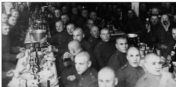
Iškilmingi bendri pietūs Karo policijos mokykloje per Kauno komendantūros metinę šventę. 1935 sausio 5 d.

mokyklos kariai privalėjo dalyvauti pamaldose Kauno įgulos bažnyčioje ir parade, kuriam vadovaudavo Kauno karo komendantas arba KPM viršininkas. Šventė buvo rengiama Nepriklausomybės aikštėje arba prie KPM. Po parado buvo ruošiami pietūs KPM kareivinėse, o vakare – rodomi kino filmai mokyklos kariams 252 .