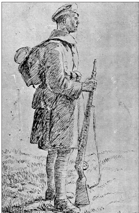
Karo milicijos mokyklos kareivio ginkluotė ir ekipuotė 1920 m. Karo policijos mokyklos kareivis, ginkluotas vokišku šautuvu „Mauser 98“ ( Kauno karo komendantūra 1919–1929 , red. P. Jurgelevičius, p. 51)

Netelpantys į šovininę šoviniai buvo dedami į kišenes. Individualius daiktus kareiviai galėjo nešiotis viršutinio drabužio kišenėje 157 . Šaudymo pratybų, kurios vykdavo vasarą, metu kareiviai dėvėjo šviesios spalvos aprangą (kelnes ir marškinius, sujuostus diržų, prie kurio buvo kabinamos šovinių dėtuvės) ir tamsios spalvos kepurės 158 . Reikėtų pažymėti, kad XX a. 3-iojo dešimtmečio pradžioje KPM kariai per pratybas dar neturėjo šalčių. Jie pradėti naudoti tik to dešimtmečio pabaigoje. Gimnastikos pratybų metu KPM karių apranga buvo marškiniai ir kelnės 159 . Vasarą gim-