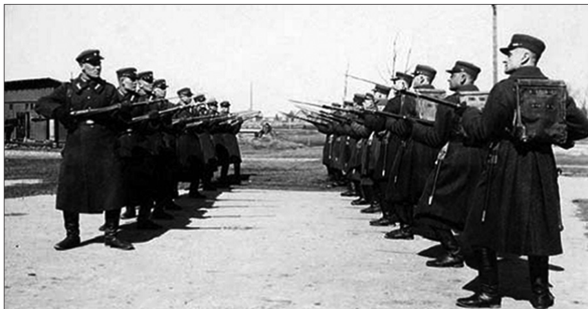
Karo policininkų karinės pratybos – durtuvų naudojimo technika – Kaune. XX a. 3-iasis dešimtmetis. ( Krašto apsauga , 2009, Nr. 5, p. 10)

sų įrengimo, taktinių manevrų pratybų metu 125 . Karių šaudymo pratybos vykdavo Eigulių šaudykloje 126 , kitos – Gaižiūnų poligone. Visus numatytus šaudymo pratimus kariai ne visada atlikdavo dėl šovinių trūkumo. Ši problema kildavo gana dažnai 127 . Ne visada buvo suspėjama surengti pratybas ir išeiti teorinį mokymo kursą ir dėl to, kad kariai turėjo eiti įvairias pareigas 128 . Kad ir daug dėmesio skiriant karo policininko mokymui, XX a. 4-ajame dešimtmetyje mokymo programoje mažiau laiko buvo numatyta specialiesiems dalykams, o daugiau – kariniam rengimui. Šios karo policininkų mokymo programos metu buvo ne tik supažindinama su karo policijos tarnyba (teisėmis, pareigomis, drausmės taisyklių laiky-