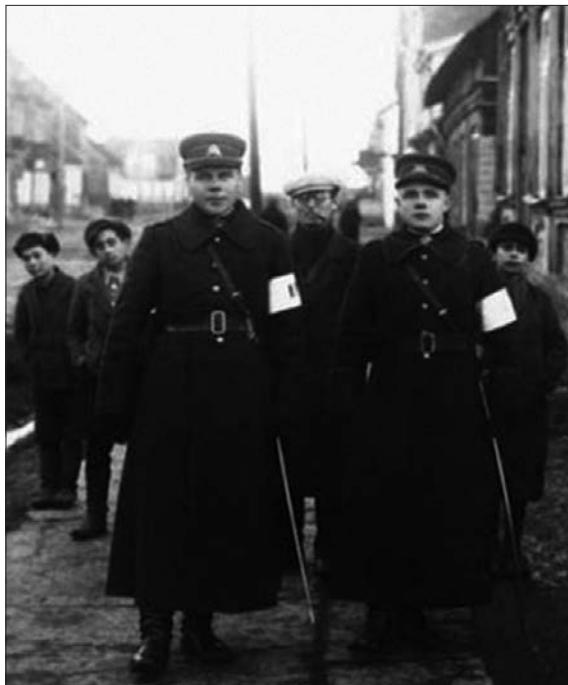
Karo policijos patruliai Tauragės gatvėje. Tauragė, XX a. 4-asis dešimtmetis ( Krašto ap- sauga , 2009, Nr. 5, p. 10)

1938 m. KPM lauko postų sargybiniams buvo pagamintas bandomasis žieminis apavas – klumpės su mediniais padais. Sargybiniai turėjo išbandyti šią avalynę ir įvertinti, ar yra tinkama kariuomenei 154 . Koks buvo tolesnis šio apavo likimas, nėra žinoma. KPM karių lauko žygio uniformą sudarė šalmas, munduras (žiemą – milinė), marškiniai, kelnės, sukišamos į batus 155 , o ekipuotė 156 – gertuvė, kabinama prie kuprinės, kastuvėlis, šovininė su perpetės diržu, lengvasis kulkosvaidis ir jo atsarginės dalys (dedamos į kuprinę).