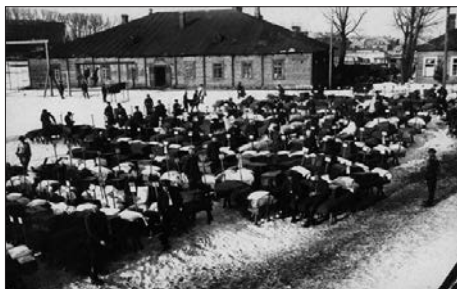
Karo policijos mokyklos kariai lauke tvarko lovas, čiužinius, patalynę

pranešimai ir pan. 275 KPM kariai ne tik klausydavosi šių programų, bet ir patys jose dalyvaudavo, atlikdavo muzikos kūrinius, specialiai parengtus vaidinimus ir pan. 276 Mokykloje rengiamų vakarėlių metu jie galėjo pademonstruoti savo kultūrinės saviveiklos rezultatus: KPM mėgėjų artistų būrelis kariams rengdavo parodomuosius vaidinimus, šokdavo baletą, styginių instrumentų orkestras atlikdavo muzikos kūrinius, kareivių choras – kareiviškas dainas, pavieniai kariai deklamuodavo savo kūrybos eiles 277 . KPM skudučių orkestras kartais pasirodydavo šiuose vakarėliuose, bet dažniausiai grodavo per vakarinius kareivių pasivaikščiojimus 278 . Kariai saviveiklininkai pasirodymus kartais rengdavo ir Kauno komendantūros metinių švenčių proga, per pietus 279 .