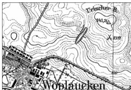
1938 m. vokiškame žemėlapyje (iškirptame fragmente) pažymėta Woplaukio mūšio vieta.

Balandžio 3 d. Vytenis įsibrovė į Prūsijos žemę su keturiais tūkstančiais rinktinių vyrų (lot. virorum preelectorum ), nusiaubė Varmės vyskupiją 71 , žemes