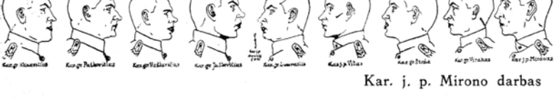
Kar. j. p. Mirono darbas