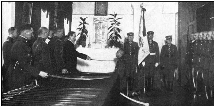
Kardų įteikimo ceremonija. 1935 m.

davo prie stalų, laukdami Lietuvos Respublikos Prezidento. Davus ženklą, orkestras užgrodavo „Prezidento maršą“, į salę įeidavo Prezidentas ir jį lydintys asmenys.