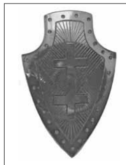
5 pav. Vytauto Didžiojo universiteto šaulių moterų korporacijos „Živilė“ ženklelis. 1935 m. Dydis – 20 x 13,5 mm LNM, M 5379