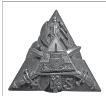
9 pav. Atsargos karininkų sąjungos ženklas. 1925 m.

Atsargos karininkų ženkleliai buvo dviejų dydžių – dideli (3,9 x 4,4 cm) ir maži (1,8 x 2,1 cm) 91 . Atsakymo, kas lėmė skirtingą ženklelių dydį, spaudoje rasti nepavyko. Tačiau, matyt, jų reikšmė nebuvo tokia pat kaip Šaulių sąjungos ženklelių. Ženklelių dydžio skirtumus turėjo lemti skirtingas gamybos laikas ir kaina. 1924 m. buvo numatyta, kad ženklas bus gaminamas iš aukso, sidabro, bronzos ir emalio. Preliminari nurodyta jo kaina – 35–45 litai, pradinis įnašas – 25 litai 92 . Ženkilai buvo pagaminti 1925 m. pavasarį, jų kaina – 40 litų 93 . Tai buvo ypač dideli pinigai 94 . Matyt, kad ne visi atsargos karininkai galėjo sau leisti tokias išlaidas. A. Astiko kataloge aprašyto didžiojo ženklo numeris – 7, mažojo – 148. Abiejų ženklų numeracija ir seka taip pat rodo, kad mažesnio ženklo atsiradimą lėmė mažesnė kaina. 1925 m. sąjungoje buvo tik kiek daugiau nei 120 narių. Jų skaičius ženkliau padidėjo tik po 1933 m. A. Astikas savo kataloge neįvardijo ženklelių