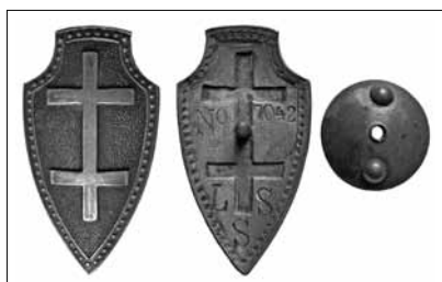
1.1 pav. Lietuvos šaulių sąjungos ženklas. Nešiojamas rikiuotėje. 1921 m. pavyzdžio. Nr. 7042. Dydis – 51 x 27 mm LNM, M 5973

klų 35 . Tačiau lieka neaišku, kada buvo pradėti gaminti 52,5 x 29 mm dydžio ženklai, kurių skydo apvade buvo 56 taškai, numeris – .../...N, įrašas – LŠS, veržlėlė – su raidėmis L.K.I.Š.K. (1.3 pav.). Lietuvos karo invalidų dirbtuvės raidėmis L.K.I.Š.K. sraigtelius pradėjo ženklinti tik nuo 1932 m., tačiau spaudoje apie naujai išleistus ženklus jokių pranešimų aptikti nepavyko. Pažymėtina, kad nors visi išvardyti požymiai ir yra būdingi kiekvienai iš trijų ženklų laidų, kartais pasitaiko išimčių – dydžio, taškų skaičiaus, numerių ar raidžių įkalimo būdo neatitikimo. Visų ženklų skiriamuosius bruožus matome lentelėje (1 lentelė).