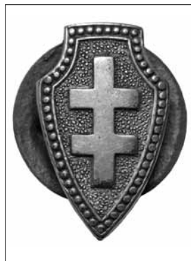
4 pav. Lietuvos šaulių sąjungos ženklelis. Nešiojamas ne rikiuotėje. Apie 1939–1940 m. pavyzdžio. Dydis – 18 x 11 mm LNM, M 969

Pagal 1937 m. kariuomenės vado patvirtintus Šaulių sąjungos ženklų pavyzdžius buvo išskirti tik narių, narių rėmėjų (raudono emalio) ir gar-