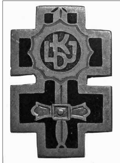
12 pav. Lietuvos laisvės kovų invalidų draugijos ženklelis. 1938 m. Dydis – 22 x 15 mm LNM, M 5347

Savo ženkleliais draugija pradėjo rūpintis 1936 m. birželio 7 d. Kaune vykusio metinio suvažiavimo metu 120 . Buvo nutarta įsigyti narių ženklelių ir draugijos vėliavą. Tačiau šis sumanymas nebuvo įgyvendintas. Kaip jau minėta, 1937 m. pasikeitė draugijos pavadinimas, o 1938 m. lapkričio 23 d. jai buvo įteikta vėliava. Vėliavoje buvo pavaizduotas Dvigubas kryžius su ant jo uždėtu kalaviju smaigaliu į viršų ir apskritime įkomponuotomis raidėmis LKID. A. Astiko kataloge įdėtas toks ženklelis (12 pav.) 121 . Draugijos valdybos iniciatyva pagaminti vėliavos, antspaudo, sidabrinio ženklo, nario bilieto projektai 1937 m. lapkričio 22 d. buvo patvirtinti vidaus reikalų ministro kaip leidžiami naudoti 122 . Draugijos ženkleliai, skirti nariams segti prie švarkų, buvo įsigyti ir nemokamai išdalyti 1938 m. 123