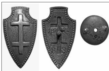
1.4 pav. Lietuvos šaulių sąjungos ženklas. Nešiojamas rikiuotėje. 1937 m. pavyzdžio. Nr. 18722. Dydis – 50 x 28 mm LNM, M 922