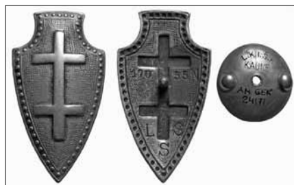
1.3 pav. Lietuvos šaulių sąjungos ženklas. Nešiojamas rikiuotėje. Po 1932 m. Nr. 17055. Dydis – 52,5 x 29 mm LNM, M 599