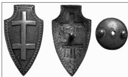
1.2 pav. Lietuvos šaulių sąjungos ženklas. Nešiojamas rikiuotėje. 1925 m. pavyzdžio. Nr. 8881. Dydis – 50 x 28 mm LNM, M 5369