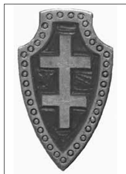
2 pav. Lietuvos šaulių sąjungos rėmėjo ženklelis. 1926 m. Šveicarija. Dydis – 19 x 11 mm LNM, M 5378