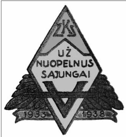
14 pav. Žydų karių, dalyvavusių Lietuvos nepriklausomybės atvadavime, sąjungos ženklas „Už nuopelnus Sąjungai“. 1938 m. Pažadėtoji žemė – Lietuva: Lietuvos žydai kuriant valstybę 1918–1940 m. Sudarytojas Vilius Kavaliauskas. Vilnius, 2013, p. 208, 211