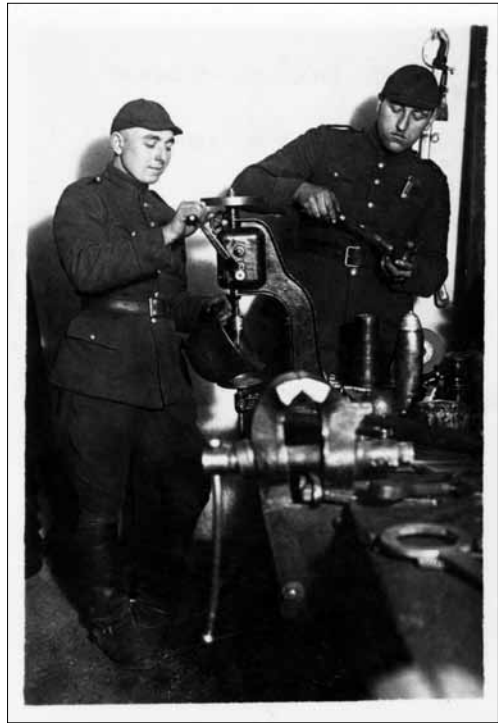
Ginklų remontas 3-iajame artilerijos pulke Kaune

palyginti trumpą laiką buvo sugadinta keliolika šautuvų (nulaužtos buožės, deformuoti vamzdžiai). Kaltininkai nenustatyti, o tyrimo protokoluose pažymėta, kad tai nutikę netyčia: buvę slidu, kareivis griuęs, o šautuvas iškritęs iš rankų ir buožė nulūžusi. Dėl šautuvo vamzdžio deformacijos (konkrečiau – „išsipūtimo“) tik paaiškinta, kad šautuvas buvęs visada gerai prižiūrimas ir valomas, o atsakingi viršinininkai dažnai tikrindavę, bet ir trūkumų nepastebėję. Aiškinantis ginklų gedimo priežastis pastebėta ir daugiau netvarkos. Perduodant ginklus iš kuopos kuopai, buvo neįmanoma nustatyti gedimų priežasčių, kadangi tyrimai pradėti per vėlai, o komisijos, turinčios apžiūrėti sugadintus ginklus, sudarytos atmetinai. Apžiūros protokolai paviršutiniški, parašyti nesilaikant nustatytos tvarkos, nenurodant net šautuvo rūšies, būklės, gavimo laiko ir pan. Divizijos vadas, susipažinęs su situacija, padarė išvadą, kad „iš tokių kvotų nesunku pastebėti kai kurių kuopų vadų ginklų priežiūroje neleistinus apsileidimus, didelę stoką atsakominguo jausmo už sugadintus ginklus ir silpną kareivių auklėjimą savo ginklų saugoti ir gerbti“ 68 . Viena iš priežasčių, kodėl taip nutikdavo, buvo kvalifikuoto ginklų priežiūros personalo ir tiesioginės atsakomybės stoka.