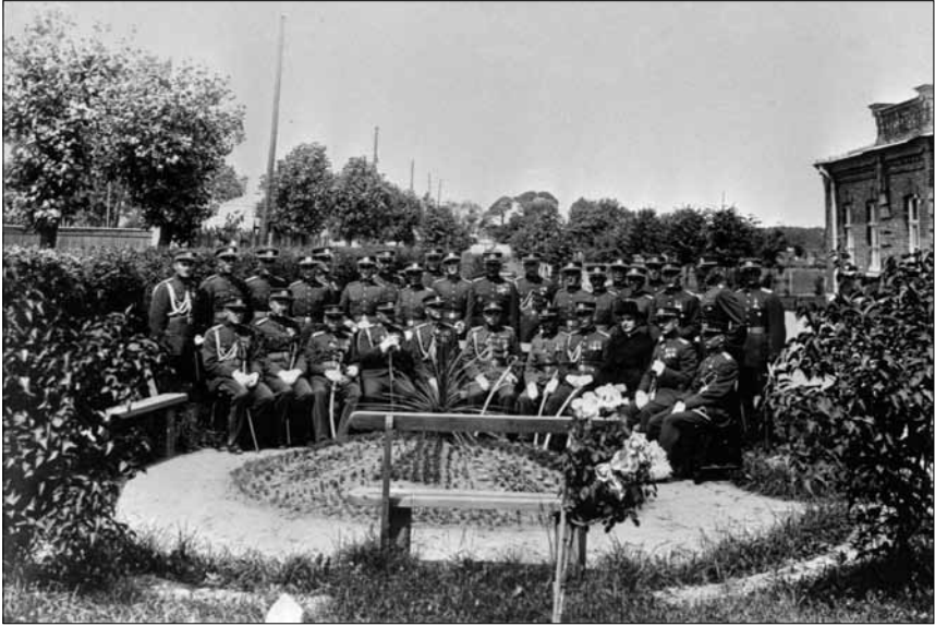
Pirmosios ginklavimo karininkų laidos išleistuvės. 1932 m.

kuriuose kariuomenės daliniuose ginklininkų pareigas vis dar ėjo atsitiktiniai kitų korpusų ir specialybių karininkai. 1934 m. sausio mėn. Ginklavimo valdybos viršininkas, keldamas šį klausimą, tiesioginiam viršininkui rašė: „Ginklavimo karininkų trūkumas ypač atsilies užsakomų sudėtingų priešlėktuvinių ginklų ir aparatų techniškoje priežiūroje. Tuo būdu ateičiai ginklų kariuomenėje priežiūrėjimo reikalą visose dalyse garantuoti reikalinga antroji ginklavimo karininkų laida.“ 116 Jis pasiūlė šią laidą komplektuoti iš paskutinio Karo mokyklos kariūnų kurso, atrinkus techninį išsilavinimą turinčius kandidatus. Tiekimo viršininko nuomone, toks komplektavimo būdas – per brangus ir savanaudiškas, turint omeny, kad jau parengti karininkai bus paskirti į ginklavimo tarnybą, kurioje nepanaudos per 2 metus Karo mokykloje įgytų žinių. Todėl jis pasiūlė palikti tą pačią tvarką, kaip ir rengiant pirmąją ginklavimo karininkų laidą. Vyriausiojo štabo viršininko sprendimu kandidatus nurodyta rinkti iš aspirantų, parengti jiems specia-