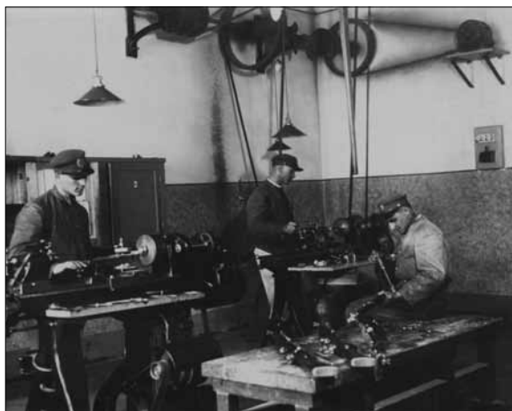
Kauno ginklų dirbtuvės. 1934 m.