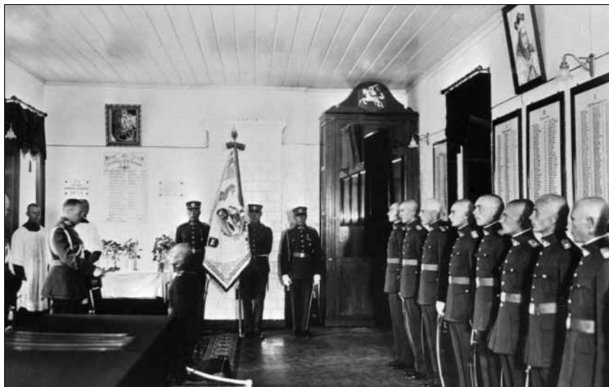
Pirmoji ginklavimo karininkų laida kardų įteikimo ceremonijos Karo mokykloje metu. 1932 m.