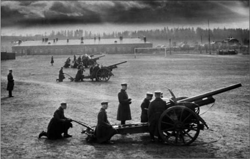
Šaudymo iš artilerijos pabūklų pratybos Karo mokykloje. 1934 m.

Karo mokyklos istoriją tyrusių istorikų teigimu, aspirantų mokymas ir auklėjimas iš esmės nė kiek nesiskyrė nuo kariūnų mokymo ir auklėjimo, tik aspirantų mokymo plane buvo labiau pabrėžiama specializacija 148 . Dėl trumpesnio mokymosi laikotarpio jų programa buvo glaustesnė nei kariūnų. Taip pat reikia pažymėti, kad kariūnų specialybių buvo mažiau nei aspirantų, todėl pastarųjų programos mokomieji dalykai kartais gerokai skyrėsi. Sutapo tik keletas bendrųjų dalykų, kurie buvo išeinami Karo mokykloje. Praktinį mokymą (stažą) ginklavimo specialybės aspirantai, skirtingai nuo visų kitų Karo mokyklos aspirantų, įgydavo Ginklavimo valdyboje ir ginklų dirbtuvėse. Ginklavimo aspirantų mokymo programą rengė Ginklavimo valdybos viršininkas, derindamas ją su Karo mokyklos viršininku ir atsižvelgdamas į jo pastabas 149 . Ginklavimo valdybos viršininkas kasmet ją peržiūrėdavo ir prireikus atitinkamai papildydavo pagal naujausius ginkla-