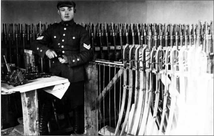
Karys (greičiausiai ginklininkas) valo ginklus 9-ojo pėst. pulko ginklų sandėlyje

Karininkai, baigę Karo mokyklą, ar vėliau, mokydamiesi Vytauto Didžiojo karininkų kursuose, išklausydavo cheminės saugos kursą. Jau 3-iajame dešimtmetyje kariūnų mokymo programoje buvo numatytas mokomasis dalykas „Cheminės medžiagos“ 91 . Tačiau, tikėtina, trumpo Karo mokyklos kurso nepakako išsamiau susipažinti su cheminio karo ypatumais, apsaugos nuo jo būdais, kad galima būtų tapti gerais šios srities instruktoriais. Ši sritis nuolat tobulėjo, todėl žinias nuolat reikėjo atnaujinti.