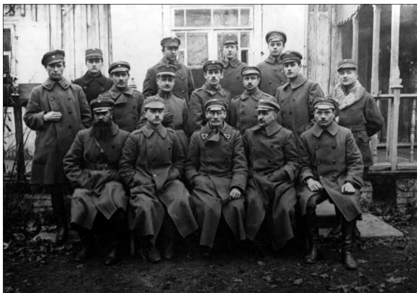
Krašto apsaugos ministerijos Artilerijos dalies personalas. 1919 m.