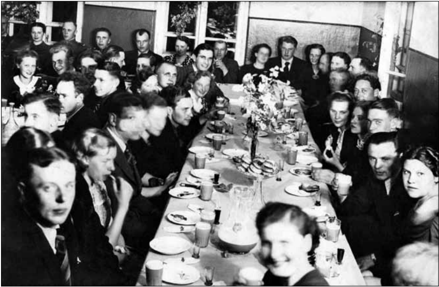
Linkaičių ginklų dirbtuvių personalas. 1939 m.

Karo atveju ginklavimo tarnybos personalas turėjo būti papildytas mobilizuotais atsargos kariais ir įvairių specialybių civiliais specialistais. Ren-giant Ginklavimo valdybos mobilizacijos planą buvo atkreiptas dėmesys į baigusių aukštąsias mokyklas specialistų ir kvalifikuotų amatininkų registraciją. Skirtingai nuo kitų kariuomenės dalinių ir įstaigų personalo, daugelis mobilizuotų karių ir specialistų karo metu turėjo dirbti kariuomenės užnugaryje esančiose įmonėse ir daliniuose arba pasilikti, kur dirbo iki mobilizacijos paskelbimo, jeigu jie ten buvo nepakeičiami ar reikalingesni nei kariuomenei 53 . Paskelbus mobilizaciją, karinės pramonės įstaigos, kaip ir visa kariuomenė, turėjo pradėti veikti karo meto režimu. Viena iš būtiniausių veiklos karo metu sąlygų – personalo išteklių papildymas, kad karinės įstaigos ir dirbtuvės galėtų dirbti didžiausiu pajėgumu. 1939 m. vasario 1 d. duomenimis, ginklavimo karininkų korpusą karo metu turėjo