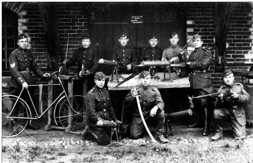
Kariai 9-ojo pėstininkų pulko ginklų dirbtuvėje. 1927 m.

1932 m. Ginklavimo valdybos viršininkas savo raporte Tiekimo skyriaus viršininkui rašė, kad Ginklavimo valdyba negali būti atsakinga už ginklų priežiūrą kariuomenės daliniuose, kol neturės tam parengtų ginklavimo karininkų. Remdamasis kasmečiais kariuomenės ginklų tikrinimo rezultatais, jis taip apibūdino ginkluotės priežiūros padėtį kariuomenės daliniuose: „Aišku, kad dalyse vyksta ginklų gadinimas, jų priežiūra nesutvarkyta, pulkų dirbtuvėse nesugeba atlikti reikalingą smulkų ginklų remontą. Neturint pulkuose techniškai paruoštų ginklininkų nėra dažniausiai net galimybės nustatyti sugedimų priežastis, jas pašalinti, perspėti.“ 67