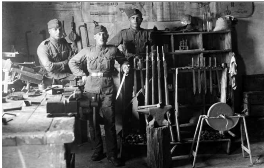
Kariai 9-ojo pėst. pulko ginklų dirbtuvėje