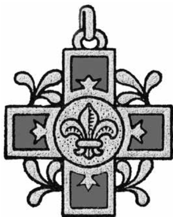
7 pav. Lietuvos skautų sąjungos Maltos kryžiaus projektas

1930 m. Lietuvos skautų brolijos statute nurodoma, kad Maltos kryžius yra dviejų laipsnių: bronzinis ir sidabrinis. Abiejų laipsnių kryžius dėvimas kairėje krūtinės pusėje: bronzinis – prikabinamas prie raudono baltais pakraščiais kaspino, sidabrinis – prikabinamas prie balto raudonais kraštais kaspino. Maltos kryžius teikiamas už žygdarbius gelbstint artimą ir tėvynę; antro laipsnio ordinas – už žmogaus gyvybės išgelbėjimą ar kitą žygdarbį, kai nebuvo pavojaus jo (gelbėtojo) gyvybei, pirmo laipsnio – už žygdarbį, atliktą, kai buvo kilęs pavojus jo gyvybei 142 . Apie šio ordino dizainą statute nerašoma, bet pateikta iliustracija (7 pav.) 143 .