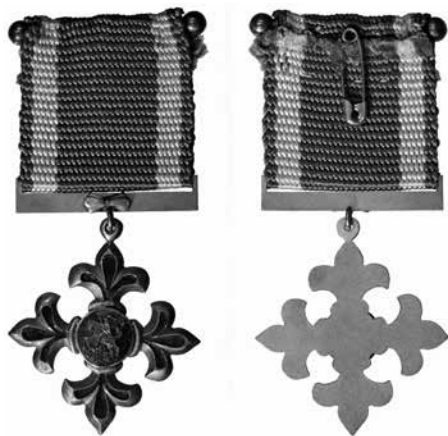
6 pav. Lietuvos skautų sąjungos Lelijos ordinas (1937–1940 m.), pagamintas firmos „Gravelit / Graviūra“ (LNM)

Nuo 1937 m. Lelijos ordinais pradėjo gaminti naujas gamintojas – graviūros dirbtuvė „Gravelit“ (6 pav.). Jai 1937 m. gegužės 1 d. už pagamintus Lelijos ordinais buvo sumokėta 90 litų 130 . 1938 m. lapkričio 15 d. tai