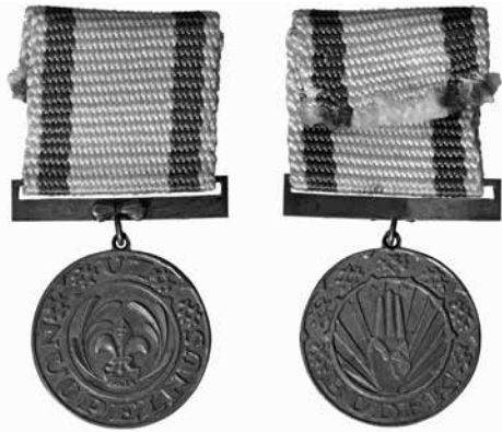
8 pav. Lietuvos skautų sąjungos ordinas „Už nuopelnus“ (1935–1940 m.), pagamintas firmos „Gravelit / Graviūra“ (LNM)

Literatūroje rašoma, kad ordinas „Už nuopelnus“ įsteigtas 1928 m., ir pateiktos tais metais keturių apdovanojimų pavardės 158 . Tačiau nei archyviniai, nei spaudos duomenys šio ordino įsteigimo datos nepatvirtina, be to, jokiuose šaltiniuose nepavyko rasti duomenų, kad literatūroje minimi asmenys būtų buvę apdovanoti. Pirmieji garbės ženklą „Už nuopelnus“ įsteigė Lietuvos jūrų skautai ir šiuo ženklu 1926 m. apdovanojo tris skautus. Tačiau jiems ženklai nebuvo įteikti, o Lietuvos jūrų skautams įsijungus į Lietuvos skautų broliją, ženklas „Už nuopelnus“ (projektas) buvo pervardytas į Lelijos ordiną. 1928 m. birželio 29 d., skelbiant įsakymą dėl apdovanojimo Svastikos ir Lelijos ordinais, ordinas „Už nuopelnus“ visai nepamirėtas. Apie ordiną „Už nuopelnus“ neužsiminta ir aprašant 1928 m. birželio 29–30 d. Kaune vykusią Lietuvos tautinę skautų stovyklą, nors kiek buvo apdovanota Svastikos ir Lelijos ordinais – parašyta 159 . Tiesa, archyviniuose šaltiniuose galime rasti žinutę, kad 1928 m. apdova-