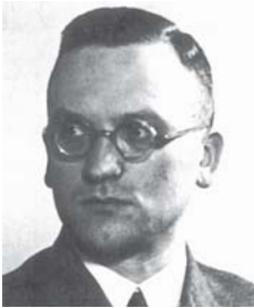
SS oberfiureris F. Pancingeris

vykdymą Ostlande 1943 m. sausio 1 d. pakeltas iki SS oberfiurerio laipsnio, o tu pačių metų rugpjūčio 31 d. apdovanotas II klasės Geležiniu kryžiumi.