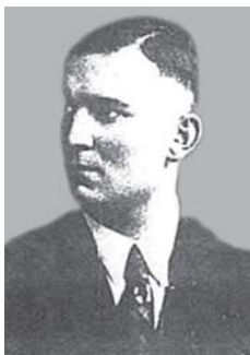
Saugumo policijos ir SD vadas Lietuvos generalinėje srityje SS obersturmbannfiureris H. J. Biomė