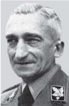
Operatyvinės grupės „B“ vadas SS grupenfiureris A. Nebė

paieškos knygą Sovietų Sąjungai“, taip pat „Informacinį lapą gyvenamajai vietai nustatyti“. Operatyvinei grupei „A“ buvo išduotas informacinis leidinys „Baltijos šalys“ su visų didesnių miestų detaliais planais.