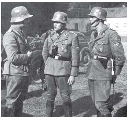
Operatyvinės grupės karininkai aptaria kovos situaciją