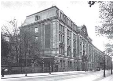
RSHA pastatas – Prinz-Albrecht-Strasse 8, Berlynas, 1932 m. nuotrauka

m. vid. – septynių, o karo pabaigoje – iš aštuonių valdybų. Būtent RSHA trečioji ( Hauptamt für SD Taetigkeit im Innland ) 75 , šeštoji ( Hauptamt für SD Taetigkeit im Ausland ) 76 ir septintoji ( Amt für Weltanschauliche Forschung ) valdybos ir buvo SS saugumo tarnyba – SD, ketvirtoji ( Geheime Staatspolizei – Gestapo ) ir penktoji ( Kriminalpolizei – Kripo ) – saugumo policija ( Sicherheitspolizei ). RSHA, kaip valstybinė institucija, dar vadinama „žinyba, kurios nebuvo“, buvo ypač įslaptinta – eiliniai Vokietijos piliečiai apie jos egzistavimą nieko nežinojo, o oficialiuose Trečiojo reicho dokumentuose ji neminima. R. Haidricho nurodymu, žymenį „RSHA“ galima buvo naudoti tik Reicho vidaus reikalų ministerijos viduje, o už jos ribų būtina naudoti tik „saugumo policijos ir SD viršininkas“ 77 . Buvo kategoriškai uždrausta