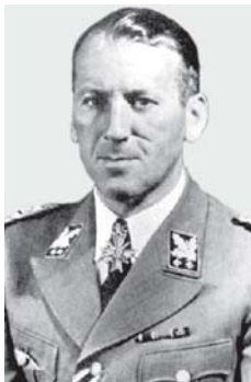
Po R. Heydricho žūties RSHA vadovu tapo advokatas SS obergruppenfiureris E. Kaltenbruneris

1941 m. gegužės 30 d. R. Haidrichas pasirašė potvarkį, kuriuo likvidavo arba sustabdė keletą gestapo ir saugumo policijos padalinių veiklą, o kitų pažemino padėtį iki karo pabaigos 98 , bei sumažino pareigybių skaičių. Be to, į SD struktūras pradėta priiminėti moteris 99 . Ši reorganizacija įsigaliojo