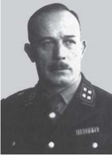
Saugumo policijos ir SD vadas Lietuvos generalinėje srityje SS štandartenfiureris K. Jegeris

operatyvinės grupės „A“ 3-jojo operatyvinio būrio viršininkas. Ir tik nuo 1941 m. gruodžio 3 d. užėmė saugumo policijos ir SD vado postą Lietuvos generalinėje srityje, lygiagrečiai iki 1942 m. lapkričio mėn. vykdydamas operatyvinės grupės „A“ 3-jojo operatyvinio būrio ( Einsatzkommando 3/A ) vado pareigas 178 . Kaip sovietų tardymo organams savo pokariniuose parodymuose teigė vyriausiasis karo komendantas Lietuvoje gen. mjr. Emilis Justas 179 , esą dėl savo minkštumo, ypač pasireiškusio akcijoje prieš žydus ir kovose su sovietiniais partizanais, K. Jegeris netiko į tas pareigas ir 1943 m. rugsėjo 15 d. buvo atleistas iš užimamo posto 180 .