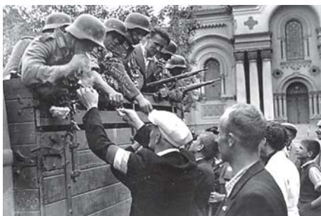
Lietuvos gyventojai su džiaugsmu sutinka vokiečių wehrmachto karius (1941-06-26)

dedanti iš vieno karininko, 2–3 puskarininkių, kelių kareivių SS rezervistų bei kelių vietinių vertėjų. Ši Kionigsberge įsteigta operatyvinė grupė veikė taip pat šiaurinėje Rusijoje (Pskovas, Novgorodas), o jos štabas nuo 1941 m. spalio 7 d. buvo dislokuotas Krasnogvardejske (Gatčina) prie Leningrado. Atsižvelgiant į teritorijos dydį (beveik pusė Vakarų Europos), grupės vadui SS brigadefiureriui