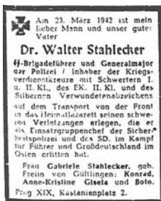
F. V. Stahleckerio mirties nekrologas