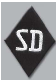
Saugumo tarnybos pareigūnų ant kairės rankovės žemiau alkūnės nešiotas rombas su raidėmis SD

V. Fuchsas buvo paaukštintas ir nuo 1944 m. gegužės 6 d. užėmė analogiškas pareigas Ostlande bei lygiagrečiai tapo SS operatyvinės grupės „A“ ( SS Einsatzgruppe A ) vadu.