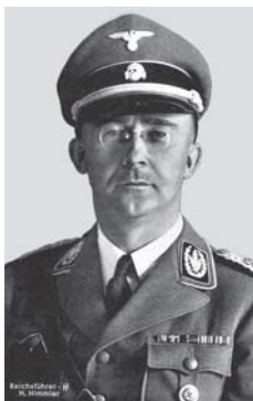
Vokiečių policijos ir SS vadas reichsfiureris Heinrichas Himleris

Nuo to laiko, kai 1936 m. birželio 17 d. H. Himleris tapo vokiečių policijos vadovu 63 , o R. Haidrichui, SD viršininkui, buvo perduotas vadovavimas saugumo policijai, tai pastarasis sutelkė savo rankose tokios apimties valdžią, kurios iki šiolei neturėjo nė vienas policijos valdininkas per visą Vokietijos istoriją. Vėliau, 1938 m. birželio 23 d. dekretu, buvo nurodyta, jog visas saugumo policijos (gestapo ir kriminalinė policija) personalas turi įstoti į SS gretas 64 .