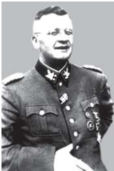
SS įgaliotinis partizaniniam judėjimui slopinti SS obergruppenführeris Erichas fon dem Bach-Celevskis

(Walter Musil) 223 nurodymu 224 visi kovoje su sovietiniais partizanais paimti ginklai privalėjo pereiti vokiečių tvarkos policijos nuosavybėn. Atiduoti ginklus kitoms įstaigoms buvo kategoriškai uždrausta. Partizanų asmeniniai daiktai (išskyrus ginklus) turėjo būti atiduodami artimiausiai SD įstaigai.