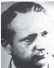
Gestapo vadovas Lietuvoje SS haupt- sturmführeris dr. H. Šmitcas

obersturmführeriu Hamanu. Dar tris dienas vokiečių saugumo policijai ir SD mieste vadovavo SS obersturmbannführeris dr. E. Ehrlingeris. Tačiau jau 1941 m. liepos 2 d. operatyvinis būrys 3/A perėmė saugumo policijos funkcijas Lietuvoje. K. Jegeris tapo saugumo policijos ir saugumo tarnybos (SD) vadu Lietuvos generalinėje srityje.