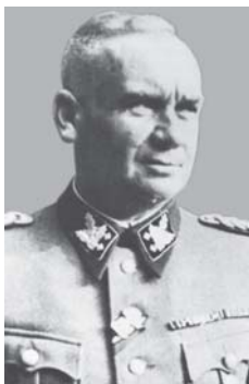
Ostlando vyriausiasis SS ir policijos vadas SS obergruppenfiureris ir policijos generolas F. Jekelnas

reicho komisarui Hinrichui Lozei ( Hinrich Lohse ). SS ir policijos vadų veiklą Rytuose, labiau negu pačiame Reiche, nepastebimai kontroliavo tiesiogiai jiems pavaldūs saugumo policijos ir SD vadai. SS ir policijos vadai galėjo leisti tik tokius įsakymus, kurie neprieštaravo saugumo policijos ir SD nurodymams 191 .