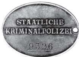
Kriminalinės policijos pareigūno tarnybinis ženklelis

Sprendžiant iš pateiktos vadovaujančių SS vadovų kadru kaitos analizės, kiekvienas naujai paskirtas SS ir vokiečių policijos vadas Lietuvos generalinėje srityje stengėsi greitai pakeisti ir vokiečių saugumo policijos ir SD vadą.