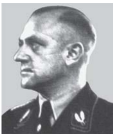
SS brigadefiureris ir policijos generolas majoras dr. H. Jostas

Dr. F. V. Stahleckerio ir policijos gen. mjr. teisės dr. Heincas Jostas 169 ( Heinz Maria Karl