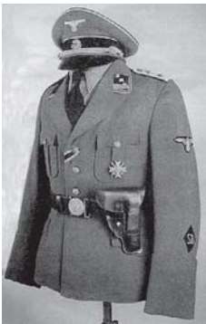
SD karininko tarnybinis munduras kasdienai