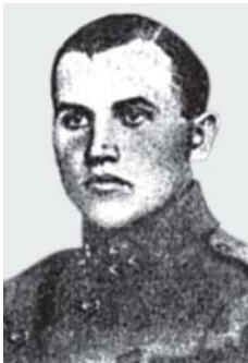
Lietuvių aktyvistų fronto vadovas pulkininkas Kazys Škirpa

Šioje vietoje verta priminti, kad iki karo tarp Sovietų Sąjungos ir Vokietijos galiojo tarptautinis generalinis susitarimas tarp Sovietų Sąjungos Vidaus reikalų liaudies komisariato Valstybės saugumo vyriausiosios valdybos ir Trečiojo Reicho NSDAP Vyriausiosios saugumo valdybos, pasirašytas 1938 m. lapkričio 11 d. Maskvoje tarp 1 rango valstybės saugumo komisaro Lavrentijaus Berijos ir Ketvirtos valdybos (Gestapo) viršininko SS brigadeführer H. Miulerio. Susitarimo pirmame paragrafe abi pusės išsipareigojo negailestingai kovoti su bendrais priešais, trečiame paragrafe – atlikti bendras žvalgybines ir kontržvalgybines operacijas. Ketvirtame paragrafe konstatuojama, kad, susiklosčius situacijai, kai iškilus grėsmė kuriai nors susitariančiai valstybei, jos informuos viena kitą ir imsisi abiem pusėms naudingų priemonių pašalinti iškilusią nepalankią situaciją. Čia galima iškelti prielaidą, kad, Lietuvą okupavus Sovietų Sąjungai, Vokietijos specialiosios tarnybos nutarė pamokyti nesukalbamus lietuvius NKVD rankomis, pateikdami Maskvai informaciją apie augantį Lietuvoje antibolševikinį pogrindį. Gal tuo galima paaiškinti pagausėjusius lietuvių patriotų areštus?