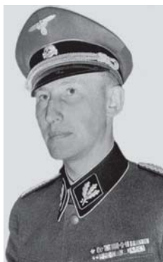
Vyriausiosios Reicho saugumo valdybos viršininkas SS obergruppenfiureris Reinhardas Haidrichas

3000 pareigūnų 69 , o 1944 m. vokiečių užimtose teritorijose SD ir saugumo policijos padalinuose tarnavo 19254 pareigūnai 70 . Niurnbergo proceso metu SD organizacijos gynėjas Gavlikas pareiškė, kad karo metais 50 % visų SD darbuotojų buvo moterys, neturėjusios teisės dėvėti SD uniformos 71 . Labai įslaptinta saugumo tarnyba užėmė svarbią vietą SS organizacijoje. 1937 m. SD pareigūnai sudarė tik 2,3 % visų SS narių, o SD vadų visame SS karininkų korpuse buvo net 10,7 % 72 .