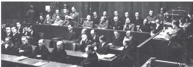
Vaizdas iš operatyvinių grupių narių teismo proceso

paminėta Vyriausioji reicho saugumo valdyba – RSHA 240 .