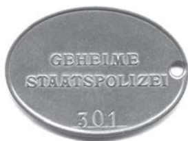
Gestapo pareigūno tarnybos žetonas