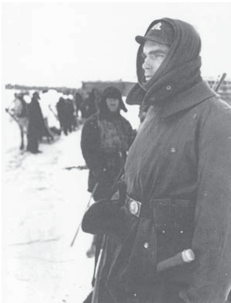
Galbūt lietuvių savisaugos dalinio karys (apie tai galima spręsti iš lietuviškos kokardos kepurėje) 1943 m. žiemą Rytuose