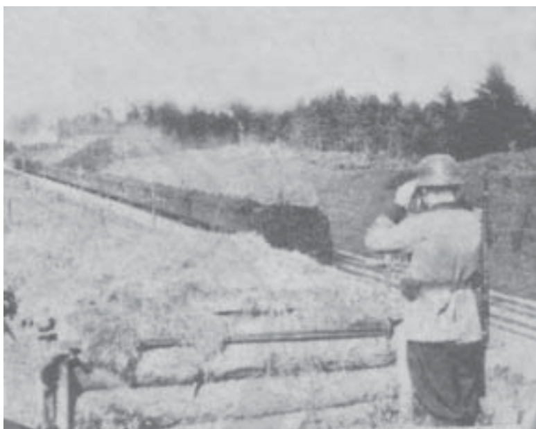
Savisaugos batalionų viena svarbiausių veiklos sričių Rytuose buvo geležinkelių apsauga nuo juos masiškai puldinėjusių sovietinių partizanų