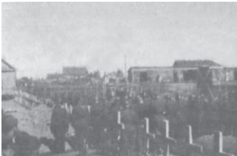
Karių kapai Adutiškio kapinėse: čia laidoti žuvę savisaugos batalionų kariai