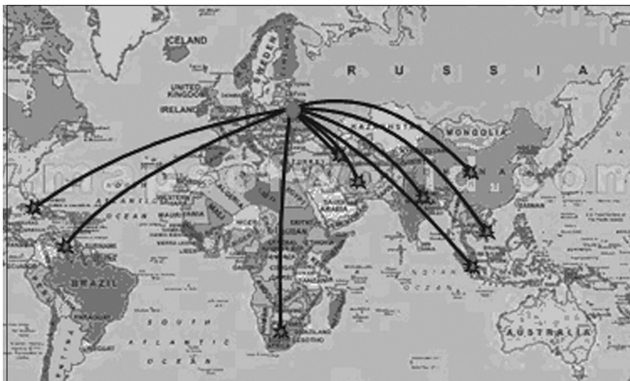
1 pav. Baltarusijos geopolitinė „atraminių“ valstybių „Pietų arka“

Kolektyvinės saugumo sutarties organizacijos mastu Minskas pasiūlė sukurti „partnersčių institutą“ tam, kad būtų išplėsta organizacijos įtakos sfera, išaugtų tarptautinis vaidmuo, ir išreiškė įsitikinimą, kad tuo susidomėtų ne tik artimos kaimynės, bet ir valstybės kituose žemynuose. 14