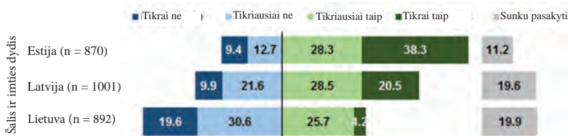
2 pav. Pasiryžimas ginti savo šalį Estijoje, Latvijoje ir Lietuvoje 2019 m. 64

2 paveikslėlyje pateikti šios apklausoje rezultatai rodo panašias tendencijas, kaip ir tos, kurios buvo nustatytos ankstesnių tyrimų metu. Pasiryžimas ginti savo šalį yra didžiausias Estijoje (66 procentai), toks lygis yra panašus į Šiaurės šalių demonstruojamą lygį 63 . Pasiryžimas ginti savo šalį yra mažiausias Lietuvoje (30 procentų), taigi Latvija lieka viduryje (48 procentai). Estijoje taip pat yra mažiausiai respondentų, negalėjusių pateikti atsakymo, patvirtinančio arba paneigiančio tokį pasiryžimą (jie sudaro 11 procentų, o tai yra beveik dukart daugiau nei Latvijoje ir Lietuvoje).