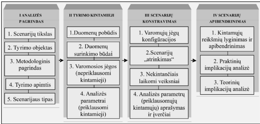
1 pav. Scenarijų konstravimo etapai (parengta autoriaus)

Apibendrinant žymiausių scenarijų konstravimo teoretikų ir praktikų pateikiamus modelius 12 , galima išskirti 4 svarbiausius scenarijų konstravimo etapus, kurie leidžia užtikrinti metodologinį prognozavimo nuoseklumą (žr. 1 pav.).