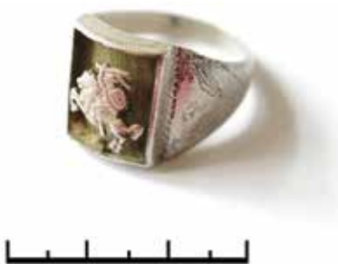
Partizano žiedas, rastas kautynių vietoje.