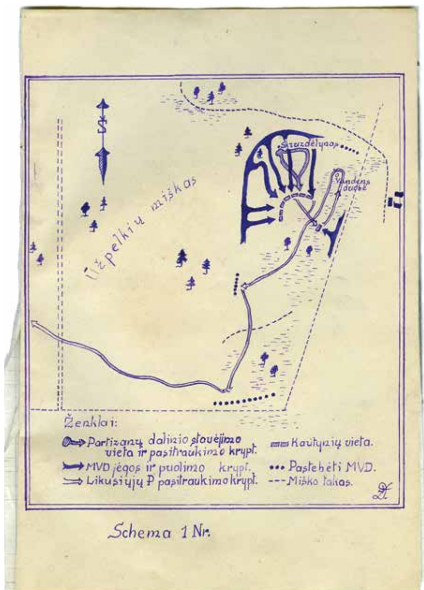
Schema 1 Nr.

Kautynių schema, sudaryta partizano Džiugo po kautynių. Lietuvos ypatingasis archyvas