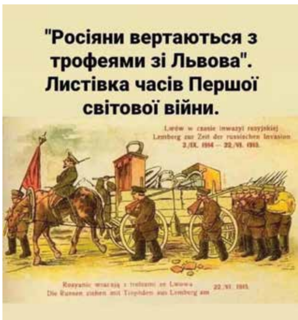
Rusų kariai grįžta su trofėjais iš Lvivo. Pirmojo pasaulinio karo laikų proklamacija.

Pasibaigus sovietmečiui, korupcija ir centralizuota komunistinė biurokratija ne tik trukdė šaliai pereiti į rinkos ekonomiką, bet ir išaugo. Tai apima ir Rusijos kariuomenę. Per pirmąjį Čečėnijos karą (1994–1996 m.) Rusijos kariai ir karininkai pardavinėjo ginklus, šaudmenis, kartais ir šarvuočius čečėnų sukilėliams. Rusijos taikdariai Balkanuose perparduodavo degalus iš Jungtinių Tautų atsargų. Kai Rusijos oro desantininkų batalionas baigė tarnybą, jo kariai kariniu transportu parskrido namo, o karininkai į Rusiją važiavo daugiau nei 120 vogtų transporto priemonių kolona.