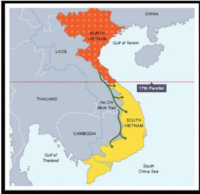
1 pav. Vietnamo padalijimas ties 17-ąja lygiagrete

1965 m. karą šalyje pradėjo manevriniai padaliniai – komunistinis Šiaurės Vietnamas su pietuose esančiais sąjungininkais Vietkongu bei rėmėjais Sovietų Sąjunga ir Kinija stojo į kovą su vakarietiškos santvarkos siekėju Pietų Vietnamu, remiamu JAV [2]. Galutinis Šiaurės Vietnamo tikslas buvo įgyvendinti komunistinę santvarką visoje šalyje, o Pietų Vietnamo – neleisti jai išplisti.