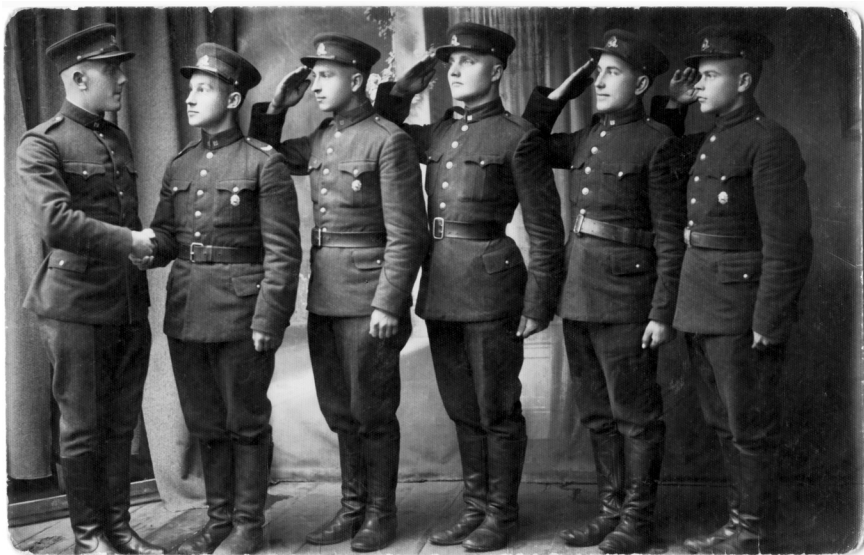
1 pav. 3-iojo pėstininkų Lietuvos didžiojo kunigaikščio Vytauto pulko kariai apdovanoti ženklais „Geram šauliui“. 1935 m. spalio 28 d., Raseiniai