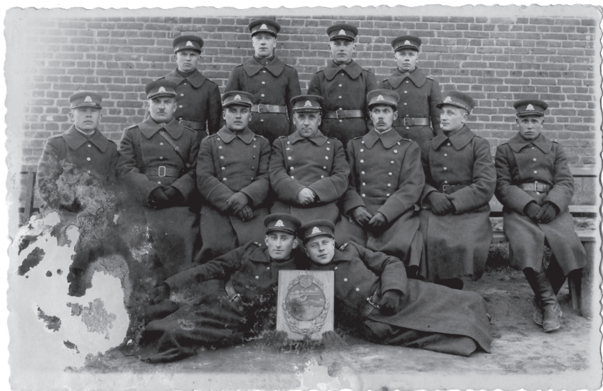
2 pav. Nenustatyto Lietuvos kariuomenės padalinio kariai su prizų už taiklų šaudymą iš šautuvų 1