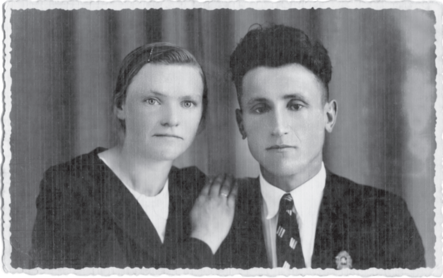
3 pav. Ženklas „Geram šauliui“ buvo prestižinis Lietuvos kariuomenėje. Privalomąją tarnybą baigę kariai juos segėdavo ir prie civilių drabužių